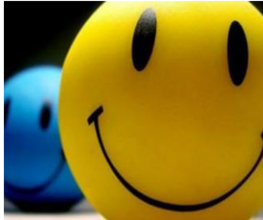
Superación Personal Y Autoestima