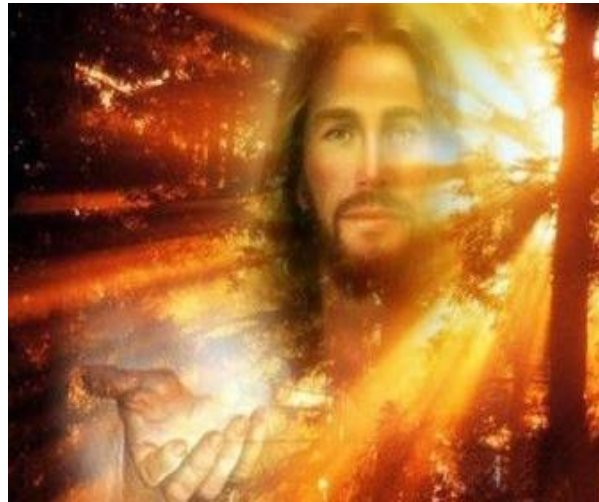
Iglesia De JESUCRISTO En Línea